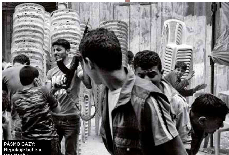
PÁSMO GAZY: Nepokoje během Dne Nagby

Nikdy mi nic nerozmlouvali. Obdivuju je za to. Kdybych měla dceru, která by něco takového jako já prováděla, myslím, že by byla přivázaná řetězem ke sporáku a nepustila bych ji z domu. ( smích ) Moje máma je v tomhle neuvěřitelná. Ví, jak jsem tvrdohlavá a jak si chci jít za tím, co dělám, takže mi za celé ty roky neřekla: „Nejezdí.“ Jasně že se o mě příšerně bála,