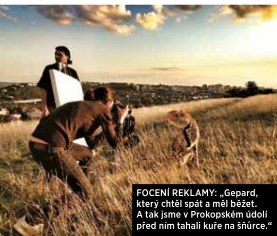
FOCENÍ REKLAMY: „Gepard, který chtěl spát a měl běžet. A tak jsme v Prokopském údolí před ním tahali kuře na šňůrce.“

Tak mi poslala zprávu, že v Saatchi dělají soutěž pro umělce do pětaticeti let a že poprvé akceptují i fotografii jako médium. A jestli nechci něco poslat. Chtěla mě rozptýlit, a hlavně povzbudit. Nakonec jsem vyhrála, dost možná právě proto, že moje dílo bylo autentické, nevyumělkované. To byla první věc, která mě nakopla, a začala jsem věřit, že to půjde. Brzy nato se mi ozvali z agentury 4D foto, která zastupuje komerční fotografy.