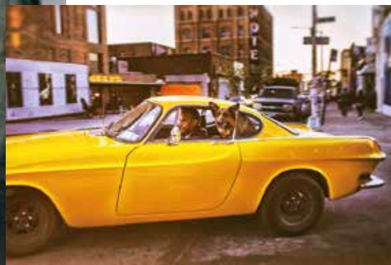
Momentka z Brooklynu

mě baví. Můžu se tam vracet, nemám striktní časové omezení, není to, že bych musela někam letět, kde by mě hodili na týden do něčeho, a plav! Tady lidem líp rozumím, rozumím jejich mentalitě, což je u dokumentu důležité právě proto, aby ses dostala do hloubky.