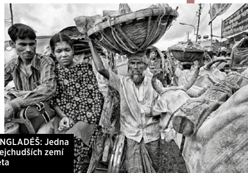
BANGLADÉŠ: Jedna z nejchudších zemí světa