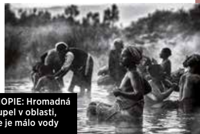
ETIOPIE: Hromadná koupel v oblasti, kde je málo vody