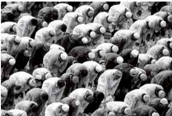
MODLITBA v Pákistánu

vesta váží osmnáct kilo, helma tři a půl a foťáky dvacet... Takže pokaždé se rozmýšlíš, jestli si tu váhu na sebe vezmeš, protože někdy je lepší být bez vesty a tedy rychlejší.) Situace každopádně byla dramatická; Izraelci řekli: „Pochod nebude! A pokud bude, zakročíme,“ ovšem Palestinci si ho nenechali vzít – a mezi nimi já bez vesty. Trčeli jsme tam asi tři hodiny a přiznávám, že jsem se hrozně bála: „Kluci, jestli tady umřu, je to vaše vina!“ kňučela jsem, když se kolem nás hnal průvod, pak začala střelba a situace se pořád zhoršovala. A tu mi jediný další novinář, Angličan, který tam byl s námi, nabídl, že mi půjčí svoji vestu – prý bude raději sedět v autě (s neprůstřelnými skly, nutno dodat). Když pak ležím v příkopu za betonovým blokem, na mně další tři Palestinci, kteří se chtěli schovat před kulkami, a snažím se něco vyfotit – protože proto tam přece jsem – zvoní mi v kapse telefon. Horko těžko ho doluju, abych se od onoho anglického gentlemana dozvěděla: „Jestli