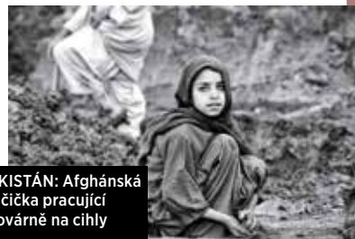
PÁKISTÁN: Afghánská holčička pracující v továrně na cihly

Fotografie, které vznikly během devíti let, kdy Alžběta cestovala po světě a vytvářela sérii dokumentů